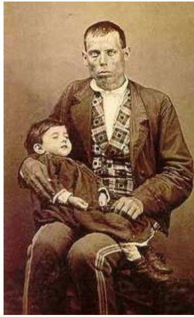
J. Rodrigo. Padre con su hijo muerto. Lorca, c. 1870.