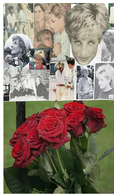
Homenaje a Lady Di con Collage fotográfico. Palacio de Kensington.