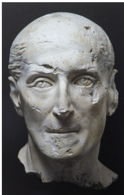
Retrato de yeso obtenido a partir de la máscara mortuoria, Museo Capitolino, Palazzo dei Conservatori, Roma, s. II d.c.